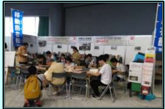
↑移民名簿や字誌などから移民一世の情報を探し出しました。

ハワイ・アメリカ本土、ブラジル・ペルー・アルゼンチンなどから訪れたウチナンチュが当館のブースを利用しました。