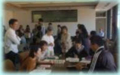
ミニビブリオバトルの様子