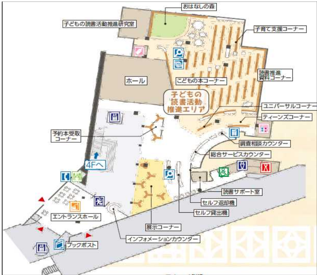
3階 2,522m 2