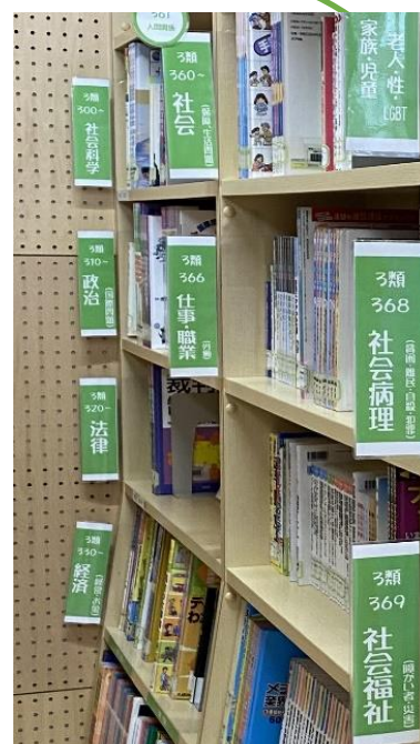
那覇市立鏡原中学校