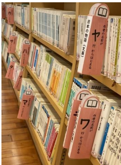
竹富町立大原中学校