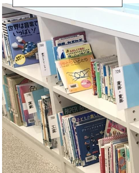
竹富町立小浜小中学校