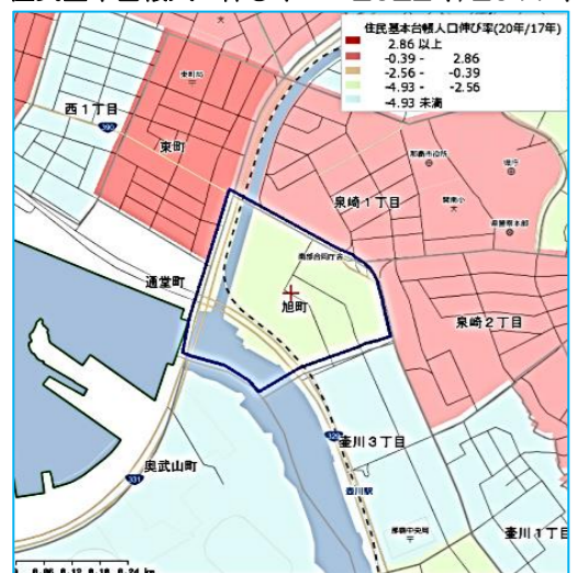
住民基本台帳人口伸び率 2022年/2017年