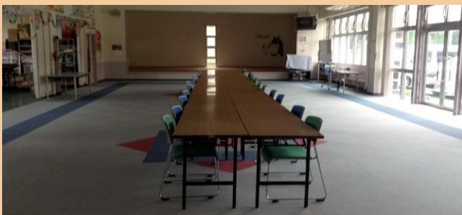
B e f o r e