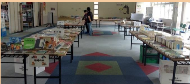
A f t e r